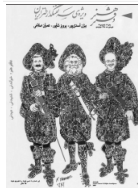
طرح رو جلد دفتر هنر مخصوص سه تفنگدار طنز فارسی

چهره ی ظاهری پرویز به خودش ارتباط داشت، با هر چهره ای که بود در هر کجا می نشست کاغذ و خود کار همراهش بود یا کاریکلماتور می نوشت و یا تصاویر موش و گربه را