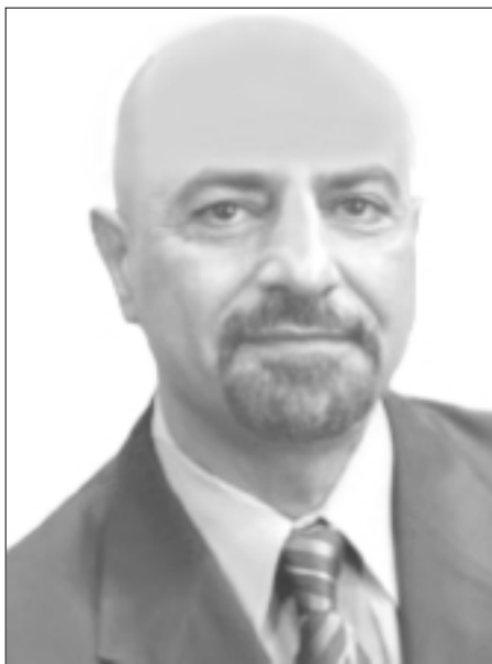
علی محمدی President

لایند می خواهید بدانید که چرا سعیدی سیرجانی به چنین عاقبتی دچار شد؟ اگر به چند نامه که او به مقامات مملکت نوشته است و ما همه را در کتاب دومی به نام «از شیخ صنعان تا مرگ در زندان» پس از مرگش به سرپرستی